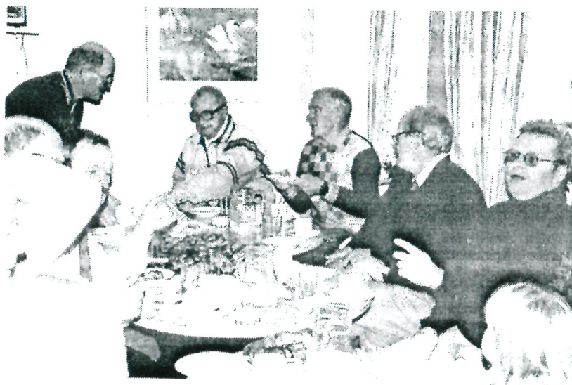
Bland frallor och wienerbröd löses alla problemställningar.

Nu börjar konditionen tryta hos en och annan. Bassängkanten blir då en lämplig viloplats. Härifrån kan ju vederbörande få ett bra frånskjut om bollen skulle komma i närheten och störa vilan. "Sidbyte!" - ropar ett par stycken.